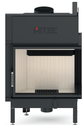
ALBERO AL16 R.H