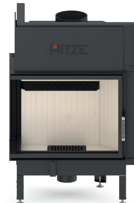
ALBERO AL16 L.H