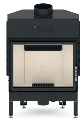
ALBERO AL16 S.H

Dodatkową zaletą maskownic wkładów kominkowych jest prosty sposób montażu, który można przeprowadzić samodzielnie.