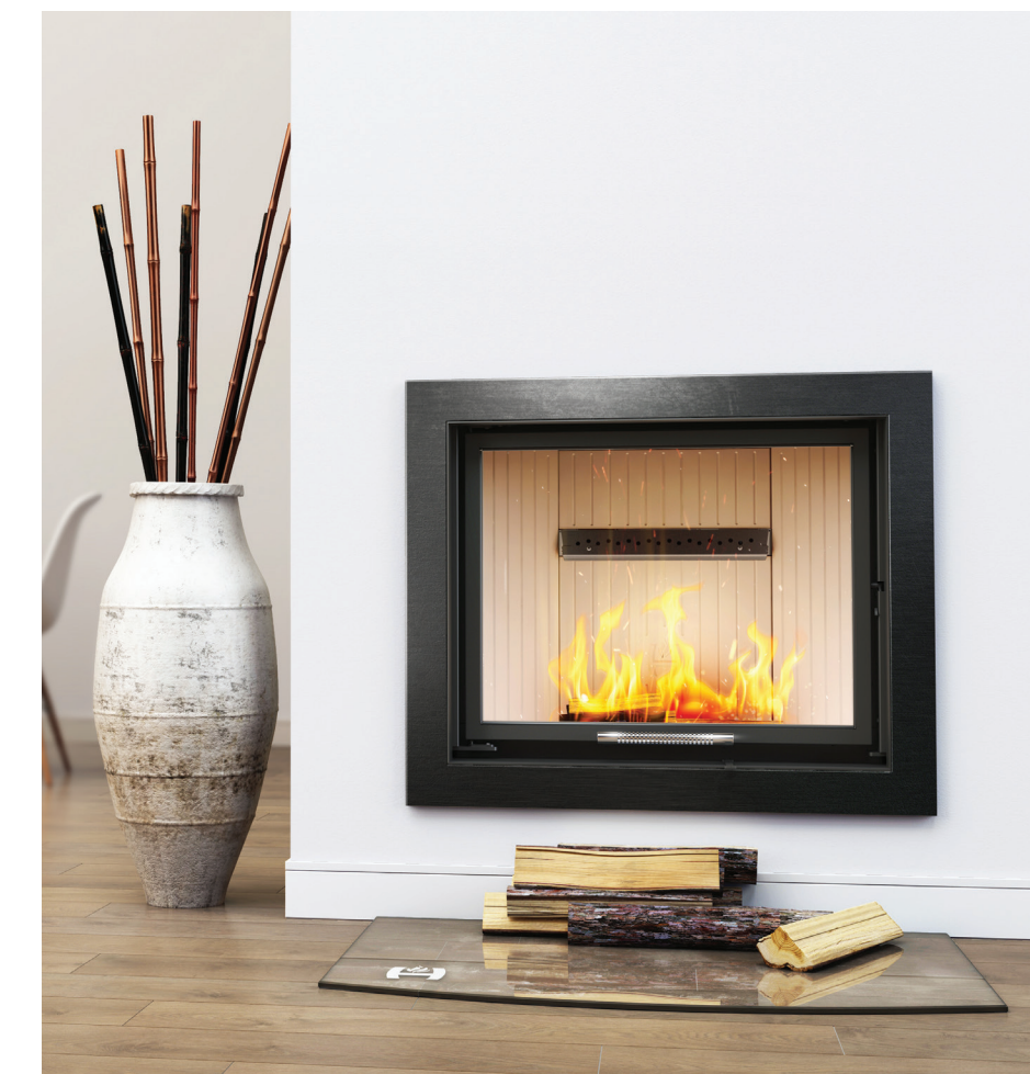
Wkład kominkowy ALBERO AL16 G.H