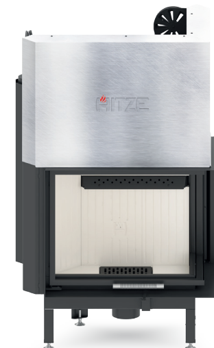
ALBERO AL16 RG.H