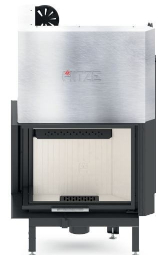
ALBERO AL16 LG.H