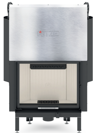
ALBERO AL16 G.H